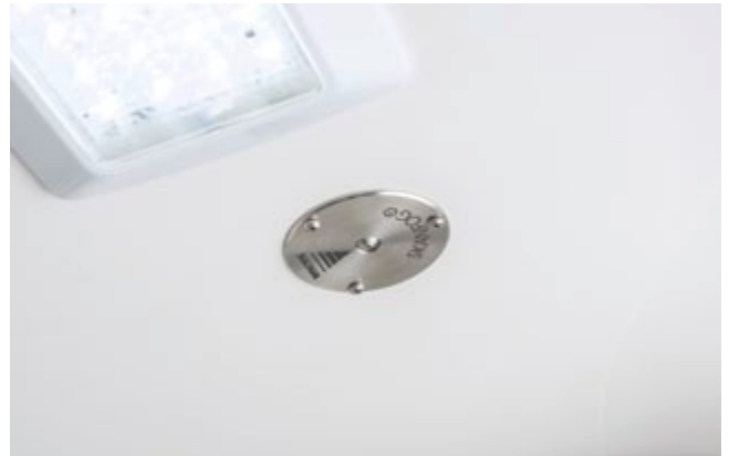
Das WAS SanSafe System beseitigt Krankheitserreger und Keime, selbst an schwer zugänglichen Stellen.