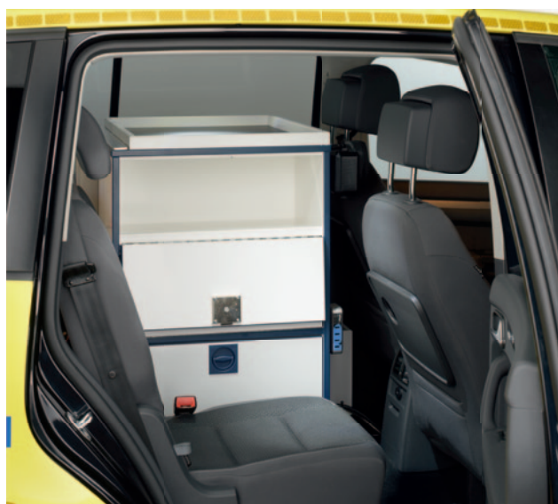
Der multifunktionelle Schrank auf der Rücksitzbank ist von zwei Seiten zugänglich und bietet Platz für zwei Sauerstoffflaschen, Verbrauchsmaterialien und eine Dokumentenablage.