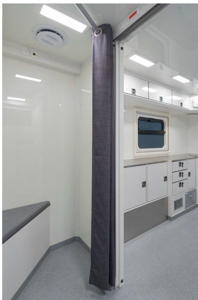
Partie vestiaire, avec rideau, pour assurer l'intimité des patients.